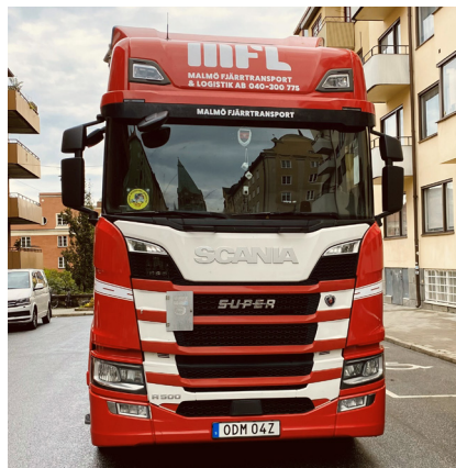
Malmö Fjärrtransport & Logistik AB

– Vi nyttjar flera av förmånsavtalen som erbjuds, bland annat bränslerabatten hos Circle K, försäkringar hos Bliwa och sjukvårdsförsäkringen hos Trygg Hansa. Vi handlar även mycket hos Swedol. Vi har även gått vissa utbildningar via Sveriges Åkeriföretag, nu senast var det digitala YKB-kurser. Jag har inte haft jättemycket kontakt med SÅ under åren men jag vet att jag kan höra av mig om jag skulle behöva hjälp med något.