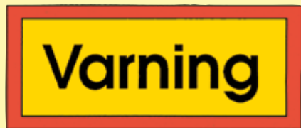
Fig 3. Varningstavla för varningsbil

Text Typsnitt: VV-typ TRATEX Färg: svart Storlek: 170/124 mm