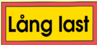
Fig 1 Varningsskyltar för transportfordon framåt och bakåt