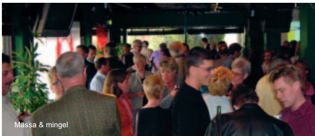
Mässa & mingel