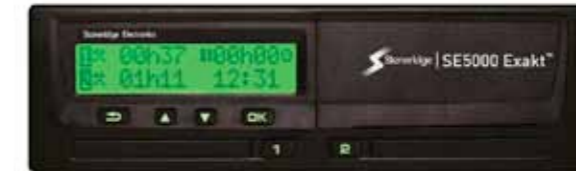
Stoneridgeskrivaren version 7.3 mäter tiden enligt det nya sättet.

Framsynta åkare har redan insett att pay-off-tiden för byte av skrivare är ganska kort. Sedan kan man tycka att EU borde betala för bytet, när de gjort ett så dåligt arbete med specifikationen för digitala färdskrivaren i ursprungsversionen, men enligt ännu obekräftade källor, har de inte visat något större intresse för detta. •