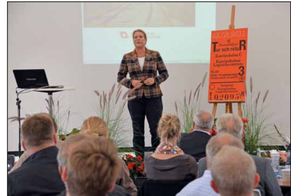
Infrastrukturminister Catharina Elmsäter-Svärd inviger Norra Terminalen av Katrineholms Logistikcentrum.