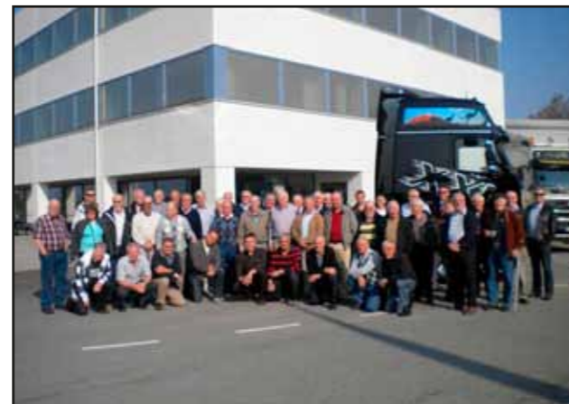
Östgötaåkarnas kamratförening på studieresa.