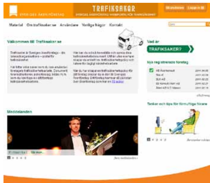
Så här ser den nya webbplatsen för trafiksäkerhet ut. www.trafiksaker.se

Nästa steg är nämligen att fastställa företagets nuläge och ange mål som man vill